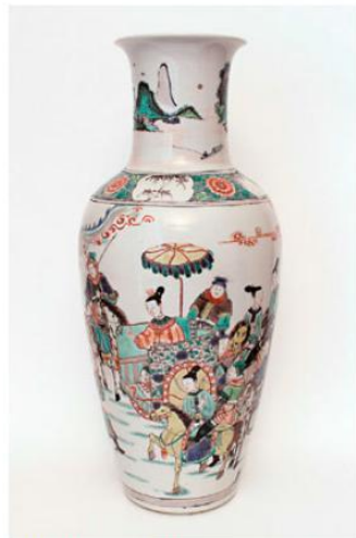
圖5 Littleton & Hennessy: 康熙朝 〈五彩瓷瓶〉。

倫敦向來就是中國陶瓷買賣交流的重要據點，因而出現不少優秀的商家業者。例如這次Priestley & Ferraro主打的一件磁州窯白罐，其刻花線條布置精巧，整體風格大方簡練。Littleton & Hennessy的一尊大型康熙朝〈五彩瓷瓶〉（圖5），該器身描繪一女子乘坐車輿，且侍者環伺身旁，形象生動活潑而色彩清麗不俗。同樣也是展示康熙朝作品的Marchant，則是把焦點放在一件〈青花瓷瓶〉之上（圖6）。而專營外銷瓷的Cohen & Cohen，今年則以老虎為主題，展示陶瓷彩繪上虎虎生風的威風模樣。展會中預計還有更多精彩的中國藝術與東方古董，準備迎接眾人參觀蒞臨。