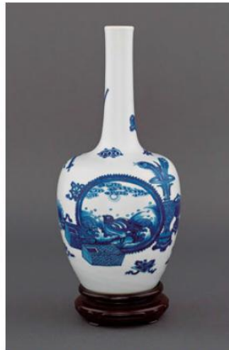
圖6 Marchant: 康熙朝〈青花瓷瓶〉。