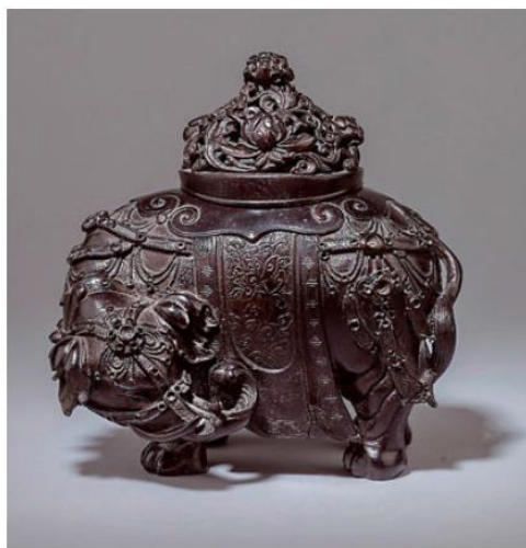
圖3 Ben Janssens Oriental Art: (象形銅器)。