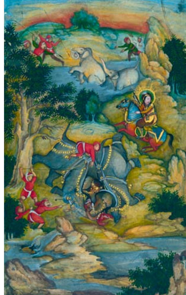
SOPRA, DA SINISTRA: "Caccia all'elefante" (dettaglio), acquerello e oro su carta attribuito a Mir Kalan Khan, Lucknow, India, 1760 circa (da Prahlad Bubbar ); okimono in argento e smalti, tardo periodo Meiji (da Laura Bordignon, Olympia fair ).