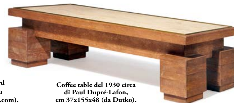
Coffee table del 1930 circa di Paul Dupré-Lafon , cm 37x155x48 (da Dutko ).

La Galerie Dutko , fondata a Parigi da Jean-Jacques Dutko , considerato un grande esperto di Art déco , ha da poco aperto una sede anche a Londra, al 18 di Davies Street in Mayfair. Tra i pezzi più importanti esposti in galleria, una scrivania del 1925-30 in bronzo ricoperta in pelle di pitone di Marcel Coard (1889-1975) e mobili di Paul Dupré-Lafon ed Eugène Printz , tra gli altri ( www.dutko.com ).